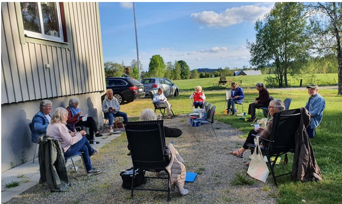
Bokcirkel med social distansering i somras